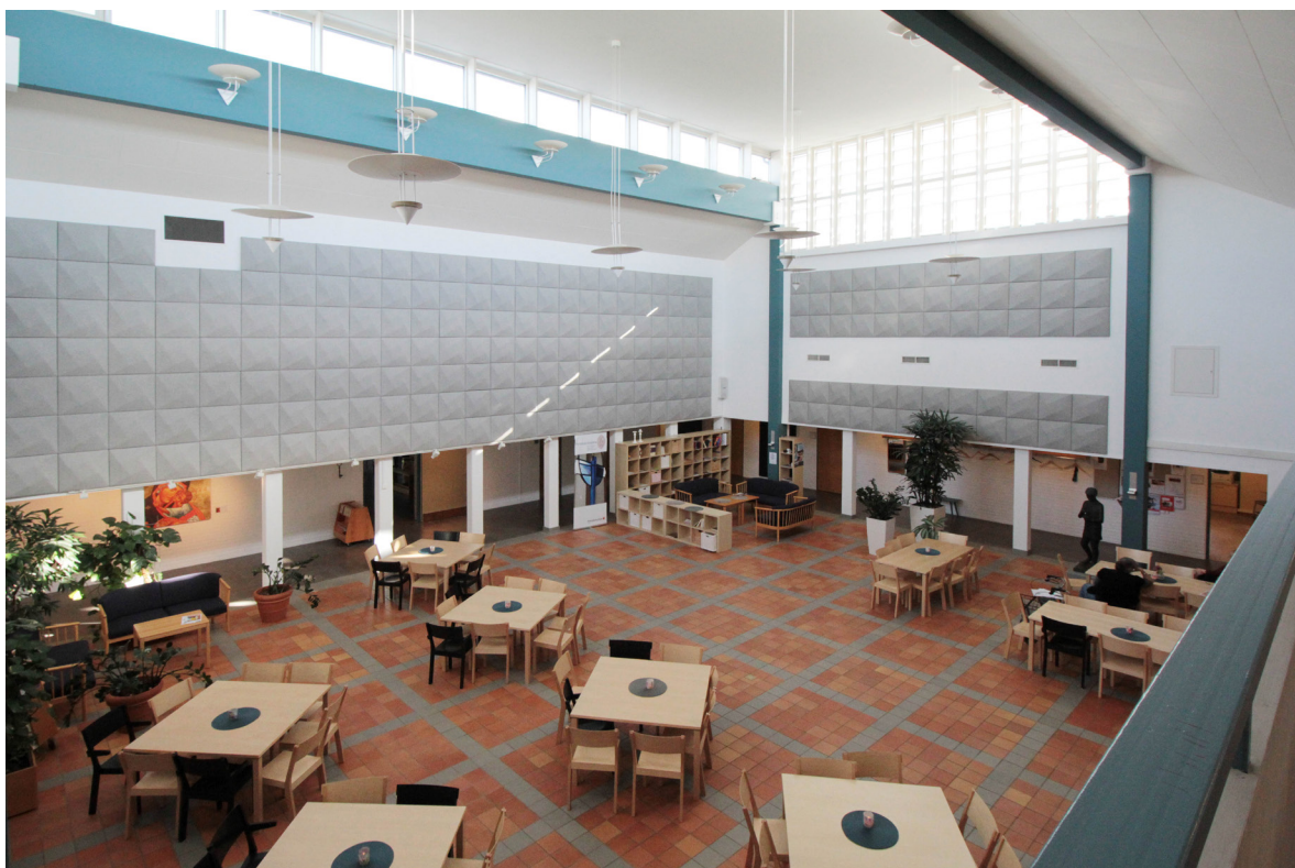
Det överbyggda kyrktorget sett från nordvästra delen av gångbryggan. Vid en av pelarna på den bortre väggen syns Ivar Åhlenius-Björks bronsskulptur från 1965. Jämför med bilden på sidan 4.

blått. Väggarna är klädda med stående och liggande håltegel lagda på flatan. Väggarna är sedan 1994 målade i en ljus terrakottakulör med tydliga penseldrag, och golvet är belagt med grå och gråröd hyvlad kalksten. Stolarna är riktade mot altaret och glas-krucifixet som är placerade mitt framför den östra väggens breda fönsterparti. Dopfunten står i linje med altaret ett par meter längre söderut. I kyrkorummets sydöstra hörn finns en grupp stolar som samlats runt ett målat krucifix. Lite längre västerut på den södra väggen står orgeln. Ovanför dörren i öster som leder ut till kyrkotomten finns Tore Ekelins glasmosaik. Kyrkorummet lyses upp av åtta ljuskronor bestående av fyra sammansatta mässingskors med stående glascylindrar.