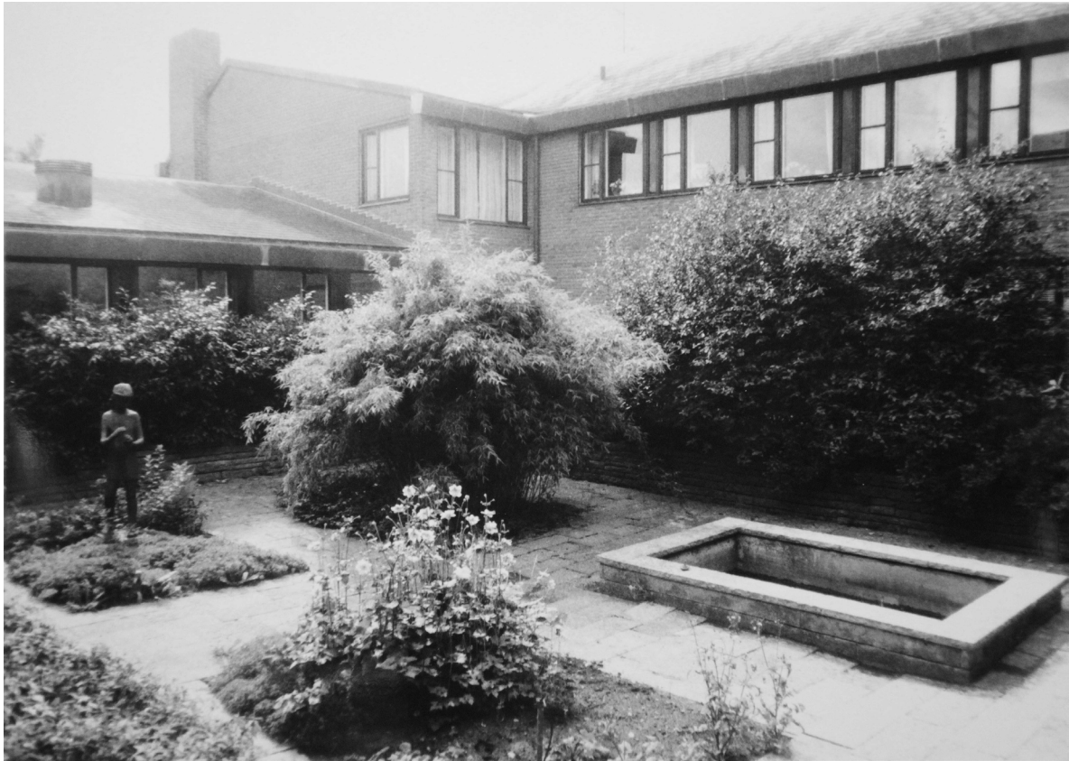
Atriumträdgården innan den byggdes över 1994. Till vänster syns bronsstatyn "Flicka med blommor" av konstnären Ivar Ahlenius-Björk.

sarkitekten Magnus von Platen i Malmö. I sydvästra delen anlades en nedsänkt ceremoniplats och i den södra en lägerbålsplats.