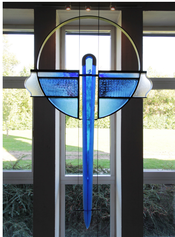
Krucifixet från 1996.