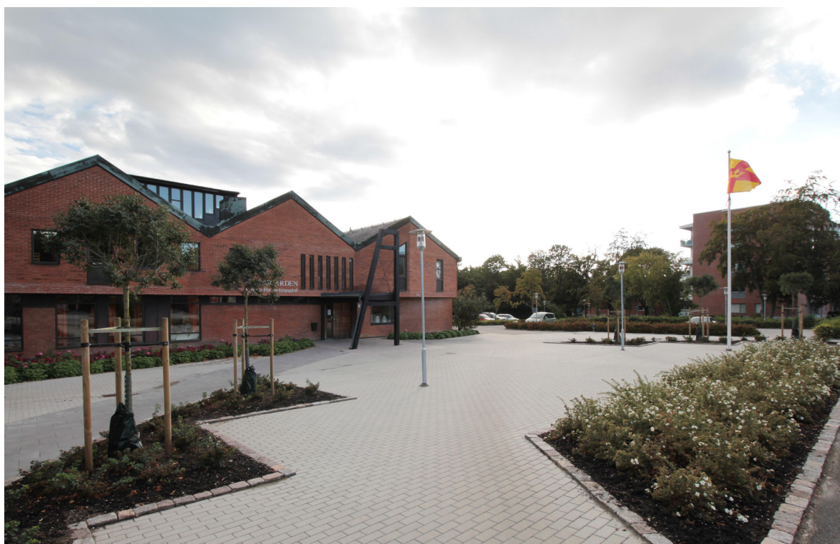
Den nyanlagda "Petersplatsen" framför kyrkans entré i norr.