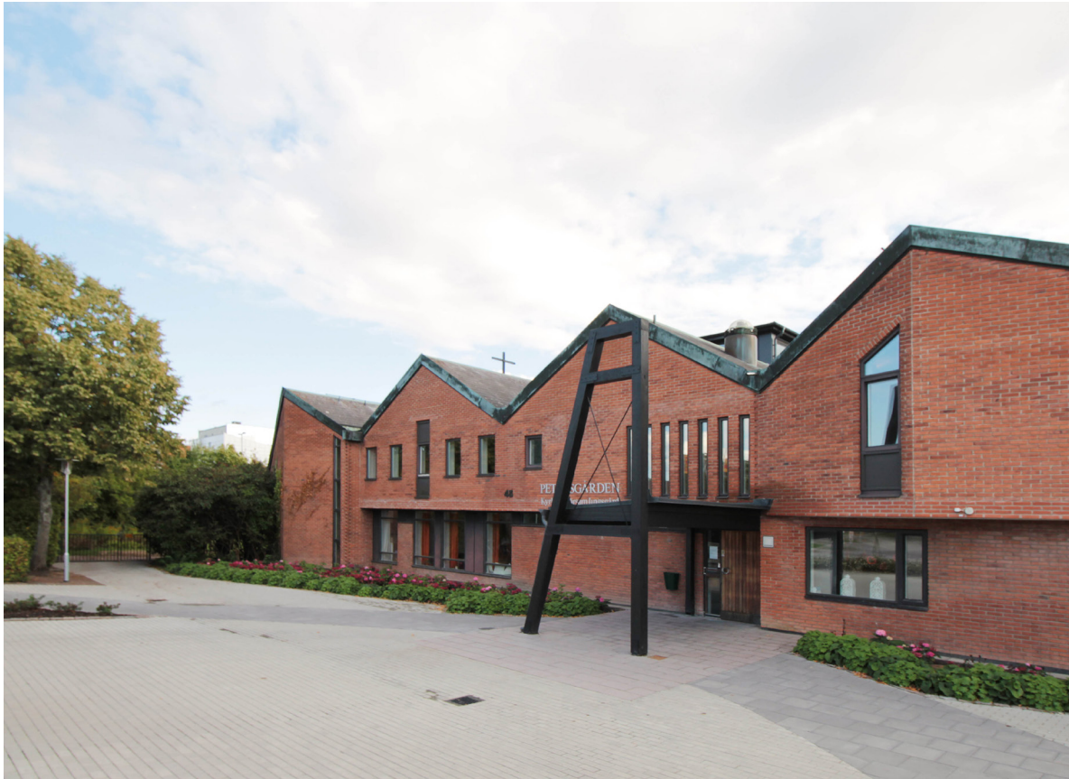
Fasaden åt norr är utformad som fyra radstående gavlar. Det svarta skärmtaket över entrén tillkom 1994.