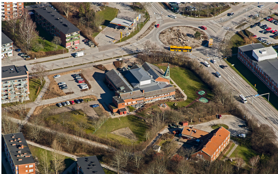
Flygbild över Petersgården och Trollebergsvägen tagen från söder, 2014.

Området väster om Ringvägen, strax söder om Petersgården, kallas Borgmästargården och byggdes upp under 1940-talet som en del av det sociala bostadsbyggandet som företogs i Lund under tidsperioden. Planen för området ritades av arkitekten Fred Forbat, men baserades till stor del på ett tidigare förslag av arkitekten Ingeborg Hammar-